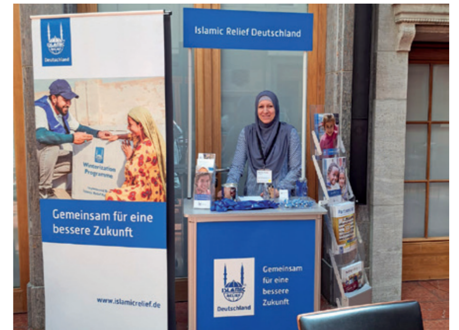
FAIR SHARE Festivalinde Islamic Relief standı

Islamic Relief, kuruluşundan bu yana oluşumu aktif olarak destekliyor ve yönetimde cinsiyet eşitliğine, sivil toplumda ise çeşitlilik, kapsayıcılık ve keşimselliğin teşvik edilmesi vizyonunu paylaşıyor.