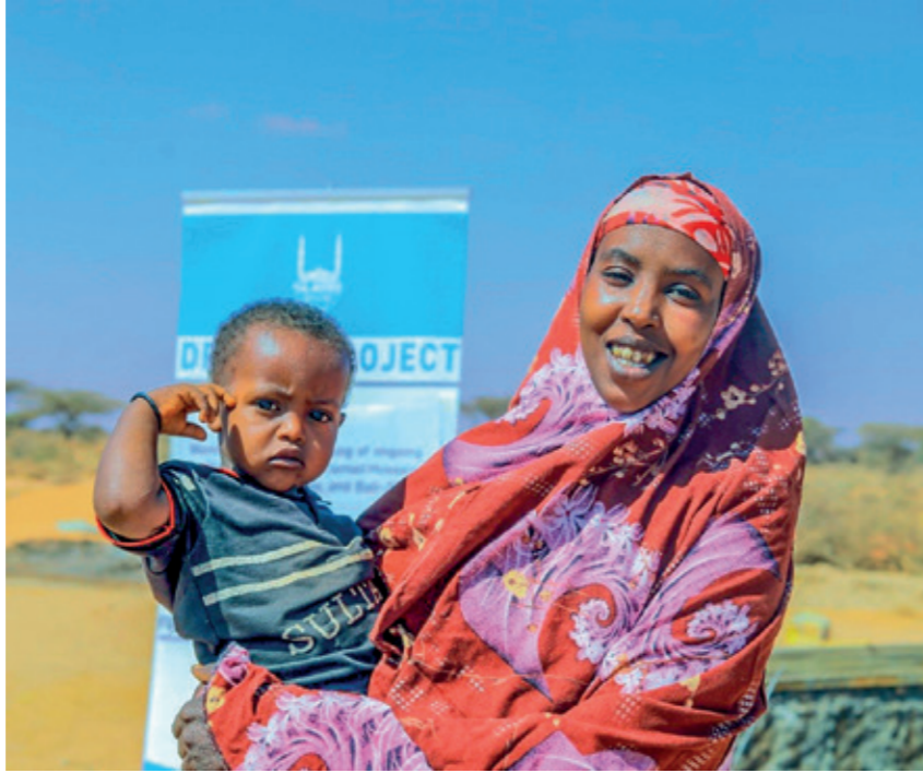
Somali'de anneler çocuklarıyla kuraklıktan kaçarak İsmail Hussein mülteci kampına sığınıyor. Islamic Relief burada 100 bin kişi için beş su deposu kurdu

Bilhassa tekrar eden kuraklık ve sellerden dolayı mağdurlar. Refah içinde yaşadığımız hayat çoğu zaman Afrika ülkelerindeki ham madde ve işgücünün sömürülmesine dayanıyor. Bu nedenle 9 Haziran 2024 Avrupa seçimleri için siyasi karar alıcıları ve sivil toplumu Afrika ile yapıcı bir ortaklık teşvik etmeye çağırdık.