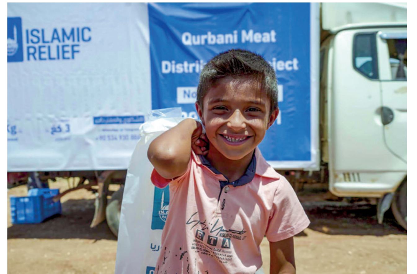
Suriyeli ihtiyaç sahibi çocuklara kurban eti dağıtımlarımız çocukların yüzünü güldürdü