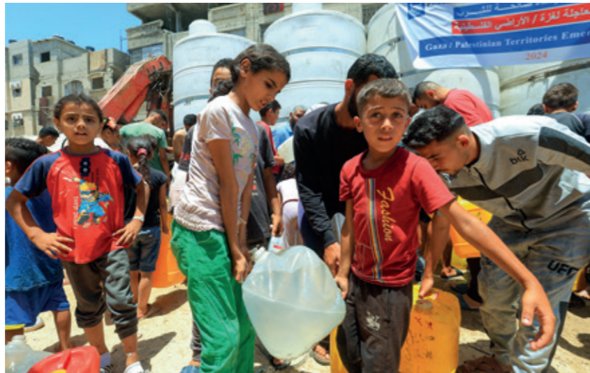
Gazze'deki feci yaşam koşullarından en çok çocuklar muzdarip

Mart ve Nisan aylarında, ülkeye girişine izin verilen yardımlarda hafif bir artış görülmesi ve piyasada daha fazla gıda bulunmasıyla gıda güvenliğinde yaşanan kısa süreli iyileşme şimdi yine geriye döndürülüyor.