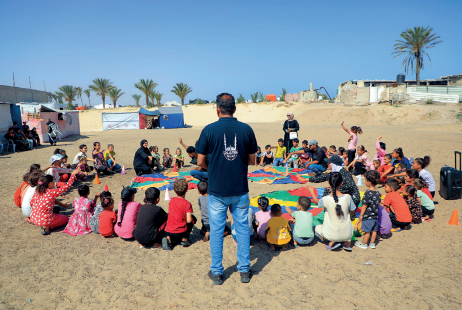
Gazze'de çocuklara uygun, oyunlu psikososyal destek

Bize verilen bir emanet. Çocuklar için bir gelecek