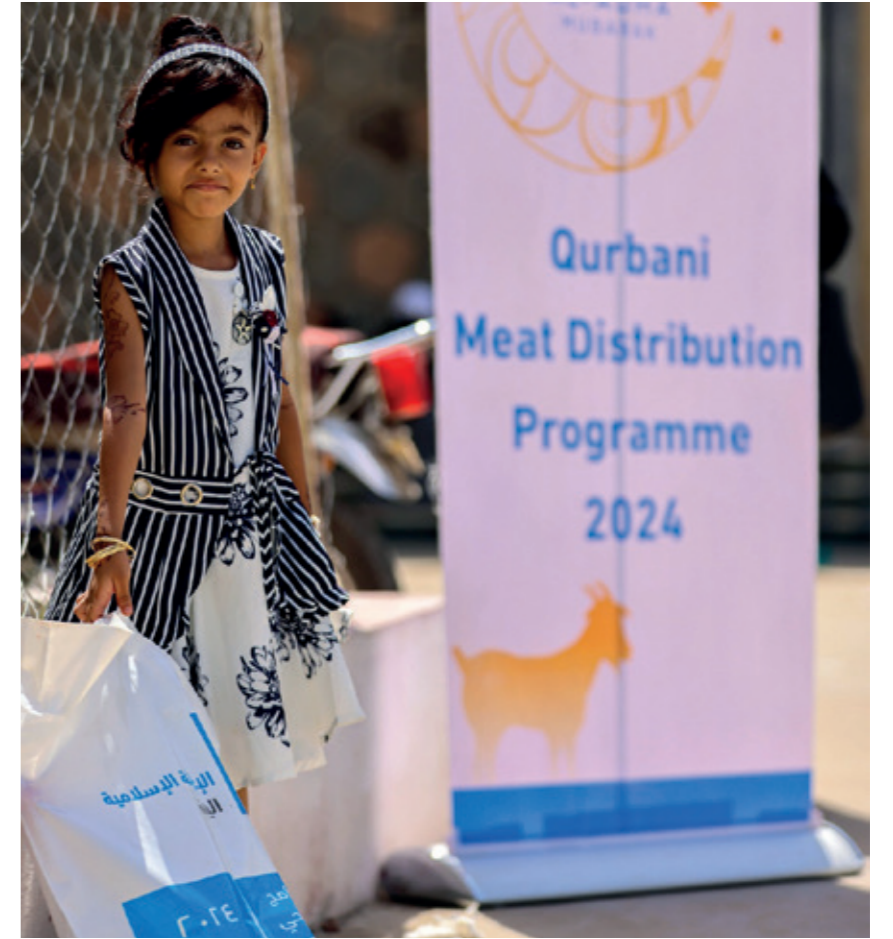
Kurban dağıtımları: Özellikle korunmaya muhtaç insanlar olarak, birçok yetim de kurban eti alıyor

Bu nedenle gıda dağıtımları, hayatlarını kolaylaştırmak ve bağımsızlık sistemlerini güçlendirmek için mümkün olduğunca çok sayıda korunmaya muhtaç insana ulaşmalı. Kurban gıda dağıtımlarımız bu yıl Sudan, Afganistan, Nijer, Gazze, Bangladeş, Kenya, Pakistan, Suriye ve Yemen dahil olmak üzere 27 ülkede gerçekleştirildi.