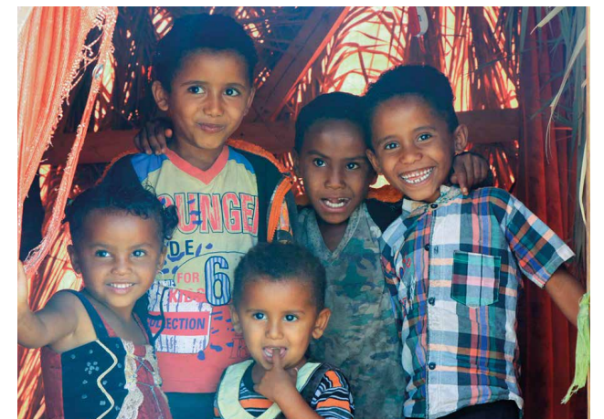
Islamic Relief verteilt lebenswichtige Nahrungsmittel an Binnenflüchtlinge