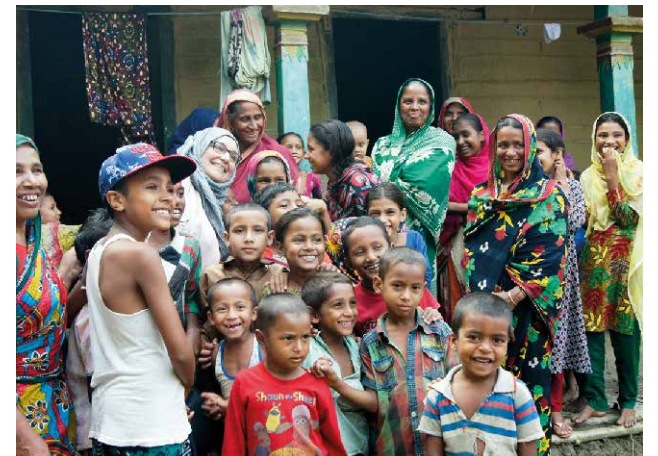
Die Dorfbewohner freuen sich über den Besuch aus Deutschland