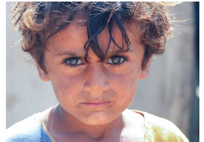
Die Lebensmittelkosten sind enorm gestiegen