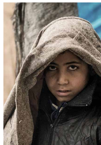
Zu der Nässe kommt die Kälte

der Camps abzumildern, disponierte Islamic Relief kurzerhand um und setzte die Winterhilfe für Schotterungsmaßnahmen und Plastikplanen ein, um die Unterkünfte vor den flutartigen Regenfällen zu schützen.