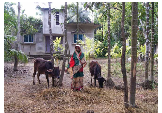
Das integrierte Entwicklungsprojekt richtet sich vor allem an Frauen