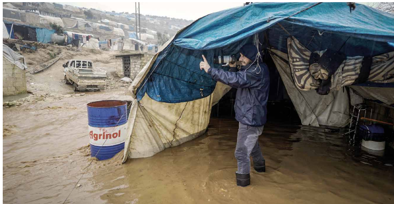
Als Zeltbewohner gibt es keinen Schutz vor den Wassermassen