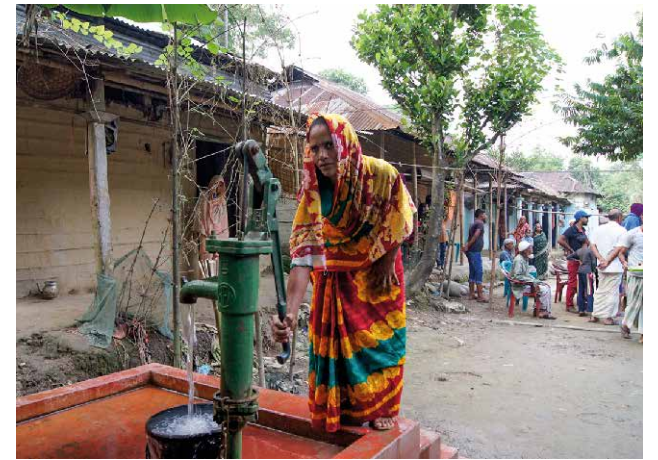
Durch den Brunnenbau haben Familien Zugang zu sauberem Trinkwasser