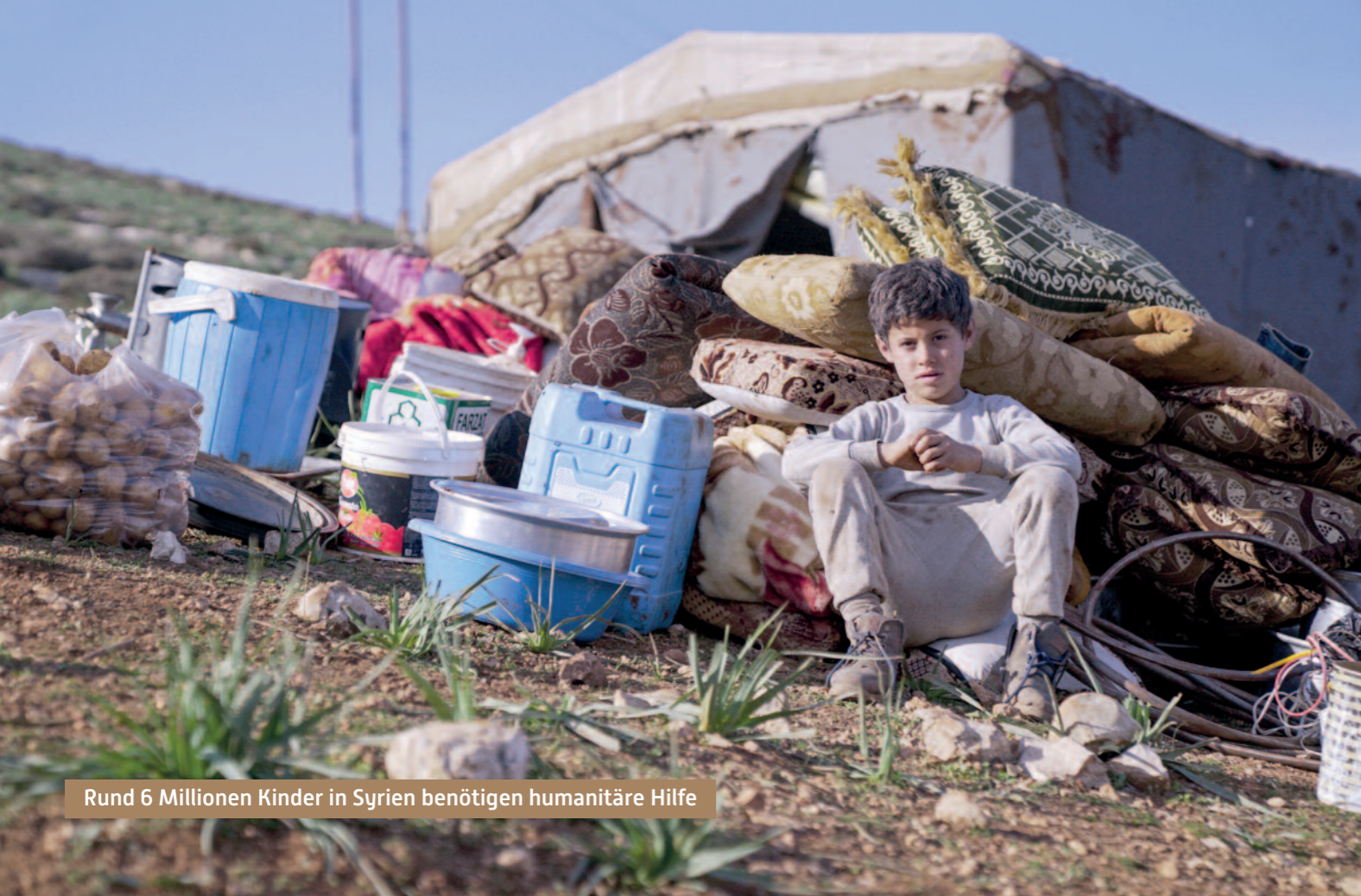
Rund 6 Millionen Kinder in Syrien benötigen humanitäre Hilfe

Anhaltende Gewalt führt zu weiterer Verschlimmerung des Leidens