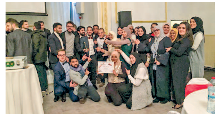
Beim Abschlussdinner der Charity Week 2017