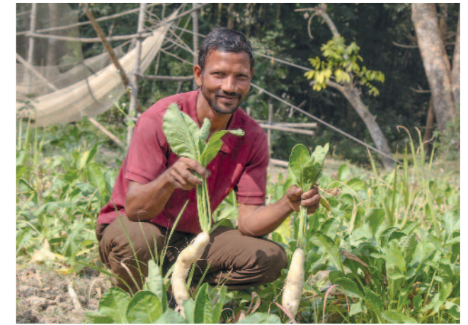
Dank der Unterstützung durch das ISD Projekt kann Parvins Ehemann die Familie ausreichend ernähren