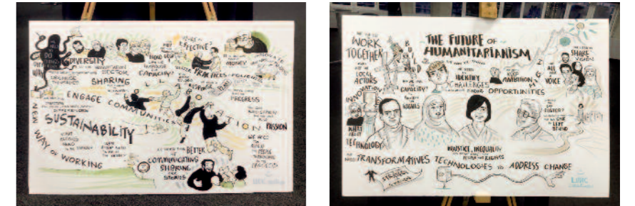
Originelle grafische Darstellungen der Themen des Forums

In der Agenda wurden drei Schlüsselthemen, die den humanitären Sektor gegenwärtig stark betreffen, behandelt: die Auswirkungen der bisherigen Maßnahmen gegen Terrorismusfinanzierung