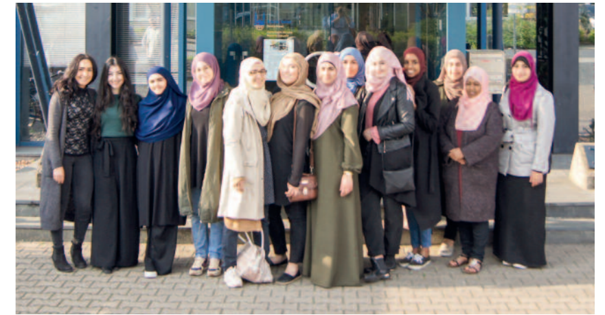
Beim Kick Off-Meeting der Charity Week im April 2017