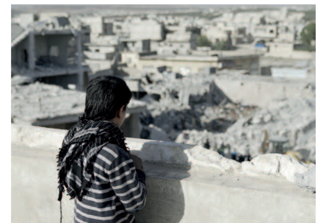
Krieg und Zerstörung in Idlib – der Entwicklungsstand Syriens wurde um Jahrzehnte zurückgeworfen