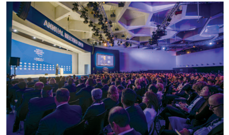
World Economic Forum (WEF) in Davos

WEF lag auf Technologie und den damit verbundenen Vorteilen, Risiken und Führungsfragen. Das WEF hat dazu auch ein Zentrum mit dem Namen Center for the Fourth Industrial Revolution eingerichtet, das neue Tech-