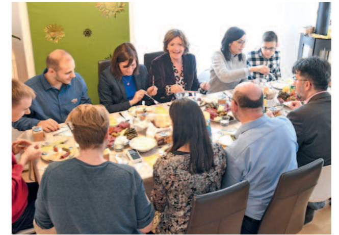
Ministerpräsidentin Malu Dreyer unterstützte die „Speisen für Waisen“-Aktion gerne