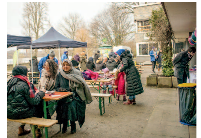
Muslime und Nicht-Muslimen tauschten sich beim Wintergrillen aus