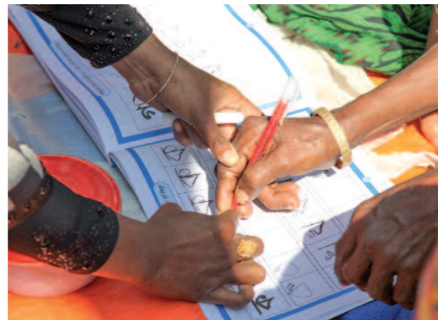
Das Projekt sorgt auch für die Alphabetisierung, insbesondere von Frauen

Obwohl die Region Potenzial für Getreideanbau, Fischerei, Gartenbau, Viehzucht und andere Wertschöpfungsketten hat, wird dies nicht ausgeschöpft, weil der Bevölkerung notwendiges Wissen darüber fehlt. Als Hilfe zur Selbsthilfe hat Islamic Relief vor drei Jahren daher erstmalig in dieser Re-