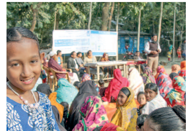
Eine Hilfe zur Selbsthilfe-Veranstaltung zum Thema Wasser und Hygiene in Tazumuddin

Deutschland hat die Finanzierung dieses Projektes im Südosten von Bangladesch mit 2,4 Mio. Euro übernommen und hilft damit 15.000 Menschen in der Region.