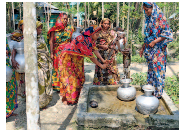
Der Bau des Brunnens erleichtert dem Dorf den Zugang zu sauberem Trinkwasser