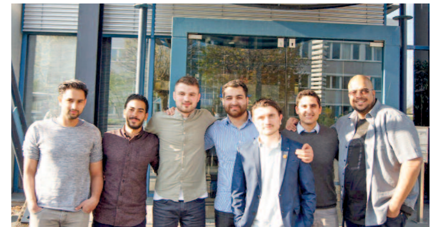
Weitere Teilnehmer des Kick Off-Meetings in Köln