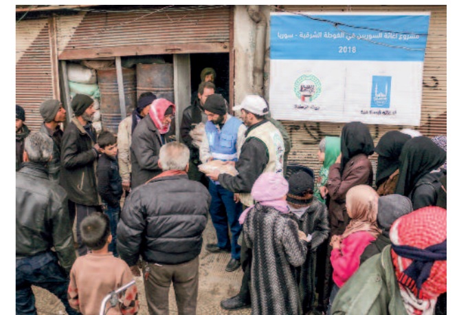
Verteilung von Lebensmittelhilfe in Ost-Ghouta, Februar 2018