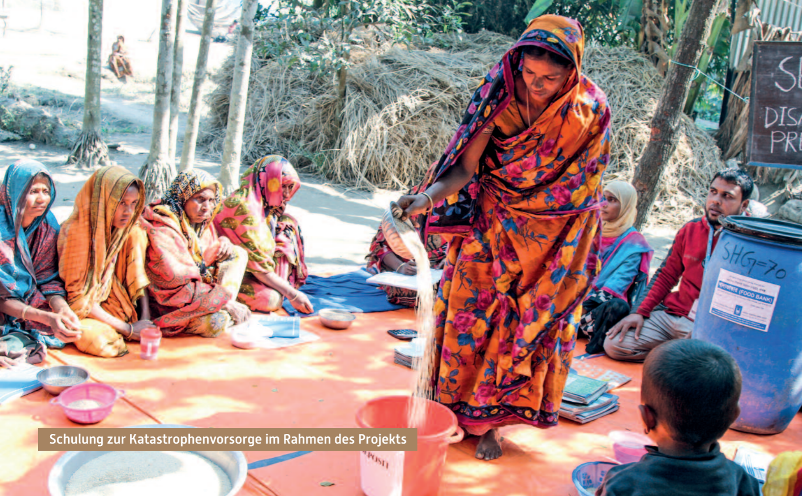
Schulung zur Katastrophenvorsorge im Rahmen des Projekts