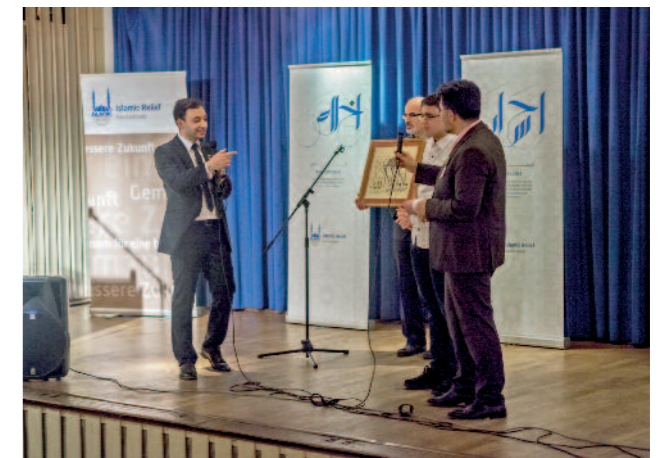
Versteigerung von Kalligrafie-Kunst für den guten Zweck beim Charity Dinner