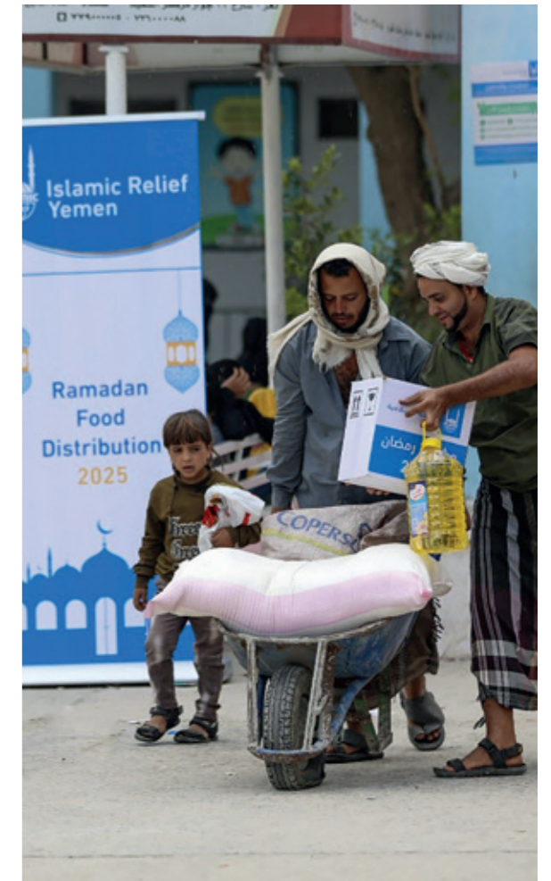
Solidarität im Ramadan: Gemeinsam schaffen wir mehr als allein