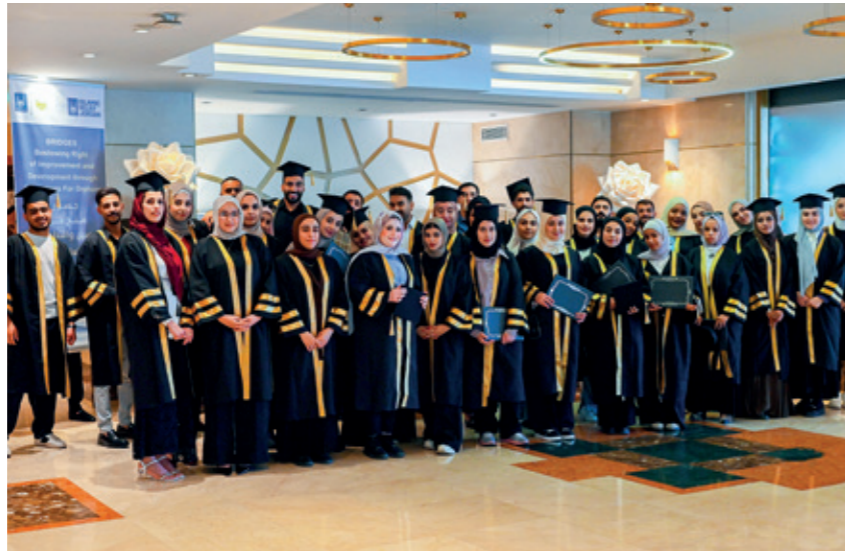
Die Absolventinnen und Absolventen bei der Abschlussfeier am 15. September 2025

30 Studierende nahmen an Schulungen in Englisch, EDV-Kenntnissen und an Bewerbungstrainings teil; 16 absolvierten ein viermonatiges Praktikum und erhielten Laptops. Bei einer feierlichen Abschlusszeremonie wurden ihre beeindruckenden Leistungen gewürdigt – ein besonderer Moment, bei dem zwei Mitarbeiterinnen von Islamic Relief Deutschland vor Ort dabei sein durften.