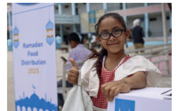
Ein Lebensmittelpaket spendet Waisenkindern und ihren Familien Hoffnung