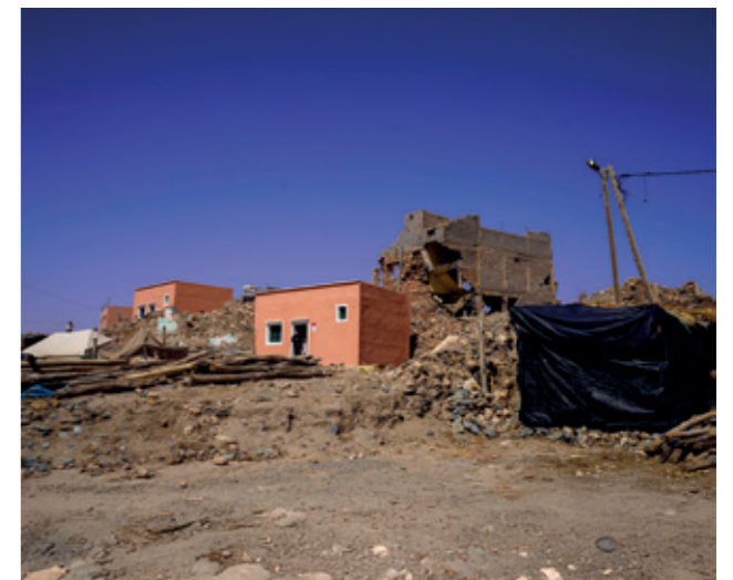
Neue Häuser, frisch gebaut, stehen neben Ruinen