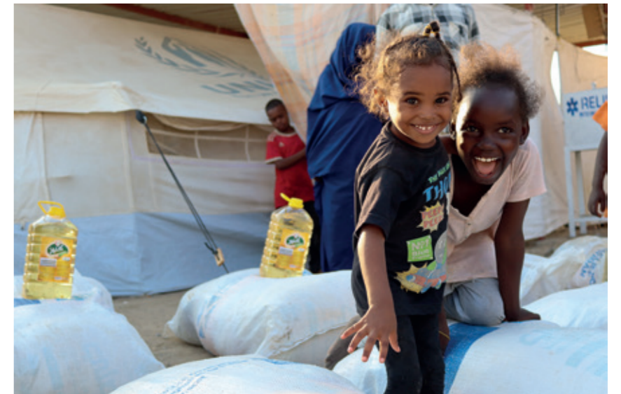
Die Hilfsmaßnahmen von Islamic Relief bringen den Kindern Momente der Unbeschwertheit zurück

Innerhalb von zehn Monaten werden Klassenzimmer saniert, Lernmate-