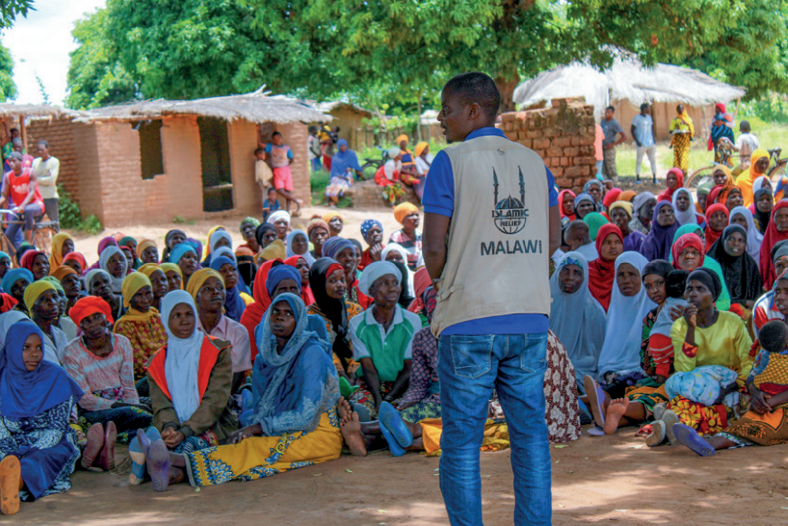
CHS-Verpflichtung 1: Von Krisen betroffene Personen können Rechte ausüben und bei Entscheidungen mitwirken. Hier bei der Ramadanhilfe in Malawi